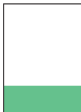
\frac{1}{4} Seite quer 184 × 64 mm