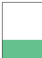
\frac{1}{3} Seite quer 184 × 87 mm