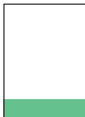
\frac{1}{6} Seite quer 184 × 42 mm