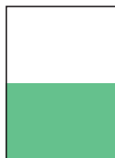
\frac{1}{2} Seite quer 184 × 132 mm